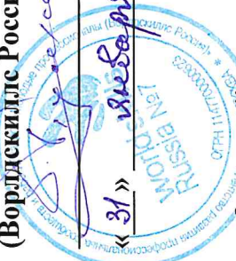
Таблица соответствия профессиональных стандартов, уровней квалификаций с компетенциями Ворлдскиллс, комплектами оценочной документации и наименованиями профессий и специальностей